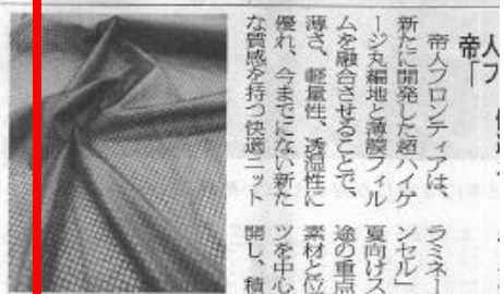
帝人フロンティアは、新たに開発した超ハイゲージ丸編地と薄型フィルムを融合させることで、軽量性、透湿性に優れ、今までにない新たな質感を持つ快適ニットを開発している。

近年の夏の気温上昇により、屋外スポーツやアウトドアシンのみならず、日常生活や日常的に楽しむウェアにも適熱性や紫外線遮断性等の高機能性が求められている。加えて、スポーツを最大限発揮するための最適な糸配地によるテキスタイル構造を実現する高次加工技術を開発したものの、また、光の透過率を最小限にしたPET系複合繊維とするなど、加工工程での加工性を