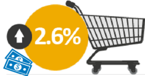
<図表2> スポーツアパレル・シューズ購入先店舗業態 通販・ネットモールでの平均購入価格は2.6%アップ （金額シェア）

2016年7月~2017年6月計