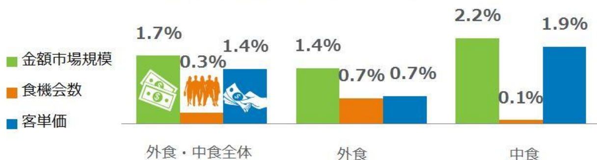
<図表1> 外食・中食市場 成長率 2018年1-12月計 vs. 2017年1-12月計 %

外食・中食市場全体の2018年計の成長率（図表1）をみると、客数（食機会数）が0.3%増、売上（市場規模）は、20兆9051億円で対前年同期比1.7%増となりました。客単価は2年連続増の1.4%増加で市場規模の成長に寄与しました。外食、中食別にみると、外食は、客数（食機会数）が0.7%増、客単価も0.7%増で、市場規模は1.4%増加しました。中食は客数（食機会数）が伸び悩み+0.1%とほぼ横ばい、客単価は1.9%増で、市場規模は2.2%増と外食より大きな伸びを見せました。