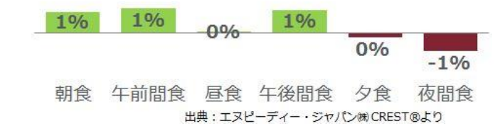
<図表3> 食機会別 食機会数成長率 2018年1-12月計 vs. 2017年1-12月計 %

食機会別の食機会数成長率（図表 3）をみると、朝食、午前間食、午後間食がプラス成長でした。働き方改革や働く女性の増加などで、朝食の外食・中食需要は高まっています。一方で、夕食や夜間食は、残業の減少や度重なる自然災害の影響でマイナス成長となりました。昼食は横ばいです。