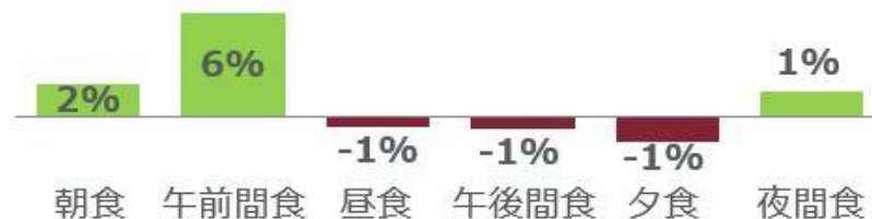
<図表3> 食機会別 食機会数成長率 2019年第1四半期 vs. 2018年第1四半期 %

食機会別の食機会数成長率（図表 3）をみると、朝食が 2%増加、午前間食が 6%と大幅増となりました。サッカー観戦の好影響もあり、夜の間食も 1%増加しました。