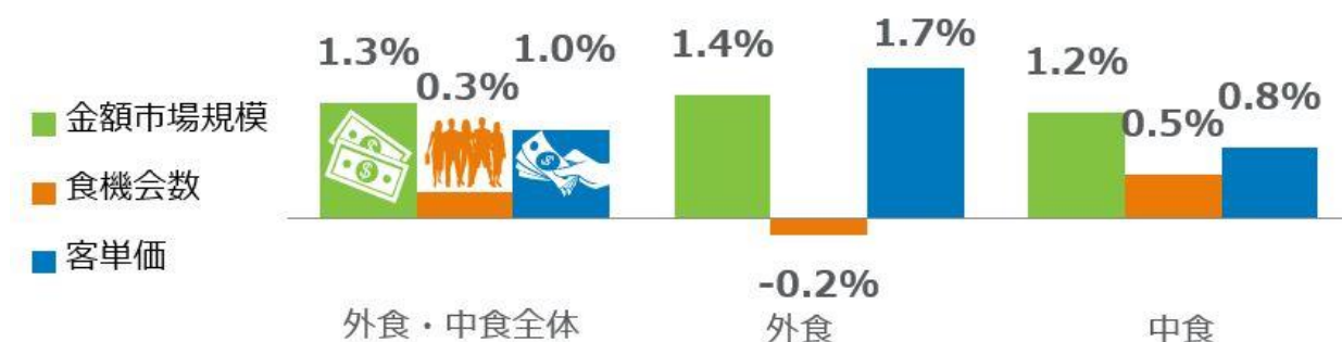
<図表1> 外食・中食市場 成長率 2019年第1四半期 vs. 2018年第1四半期 %

外食・中食市場全体の 2019 年第 1 四半期の成長率（図表 1）をみると、客単価の 1.0%増が寄与して、売上（市場規模）は、5 兆 2536 億円で対前年同期比 1.3%増となりました。客数（食機会数）は、前期まで 2 期連続プラス成長で、今期は+0.3%の微増となりました。中食の客数は 0.5%増加したものの、外食で 0.2%減となりました。客単価は、外食でも中食でも上昇しました。