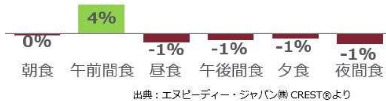
<図表3> 食機会別 食機会数成長率 2019年第2四半期 vs. 2018年第2四半期 %

10 連休の影響は、平日の需要を奪い、普段使いの店は苦戦しました。さらに、旅行や行楽にお金を使ったことで、連休後に食事コストの節約傾向が高まったようです。また、食品や外食の値上げが相次いだこと、増税を控えていることで、節約志向が高まっています。長すぎる連休は、外食・中食業界にとって、あまりプラスにならないこともあることから、休日需要をいかに取り込むか対策していく必要があります。