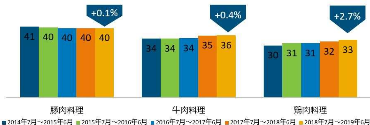
<図表1> 外食・中食で食べられたメニュー 種類別サービング数推移（単位：億サービングス）

外食・中食で喫食された肉メニュー *2 を、牛肉、豚肉、鶏肉を使った料理別にサービング数 *3 推移をみると（図表1）、直近1年（2018年7月～2019年6月計）の成長率は、鶏肉が2.7%増、豚肉が0.1%増、牛肉が0.4%増で、鶏肉料理が最も増加したことが分かりました。鶏肉料理の増加は4年連続でした。