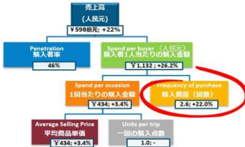
＜図表2＞スポーツシューズ市場規模と成長率