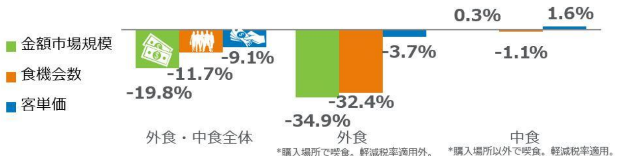
<図表1> 外食・中食市場 成長率 2020年8月計 vs. 2019年8月計 %

外食・中食市場全体の2020年8月の前年同月比（図表1）をみると、売上（金額市場規模）が19.8%減少、客数（食機会数）が11.7%減少しました。感染拡大による影響のピークは、2020年4月で市場規模41.9%減でした。5月は37.7%減、6月は23.6%減で、7月は19.4%減で、7月より0.4ポイント回復が後退しました。食機会数は7月より2.3ポイント回復しました。