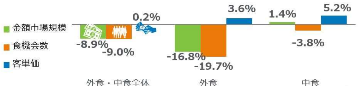
<図表1> 外食・中食市場 成長率 2020年10月計 vs. 2019年10月計 %

外食・中食市場全体の2020年10月の前年同月比（図表1）をみると、売上（金額市場規模）が8.9%減少、客数（食機会数）が9.0%減少しました。感染拡大による影響のピークは、2020年4月で市場規模41.9%減でした。5月は37.7%減、6月は23.6%減で、7月は19.4%減、8月は19.8%減、9月は17.5%減で、10月は9月より8.6ポイントと大きく回復しました。食機会数は9月より2.6ポイント回復しました。