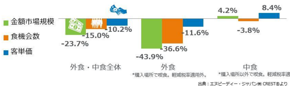
<図表1> 外食・中食市場 成長率 2021年4月計 vs. 2019年4月計 %

外食・中食市場全体の2021年4月の2019年同月比（図表1）をみると、売上（金額市場規模）が23.7%減少、客数（食機会数）が15.0%減少しました。感染拡大による影響のピークは、2020年4月で市場規模41.9%減でした。5月37.7%減、6月23.6%減、7月19.4%減、8月19.8%減、9月17.5%減、10月8.9%減、11月12.4%減、12月19.2%減。2021年は1月26.3%減、2月24.4%減、3月は21.9%（いずれも2019年同月比）とマイナス幅は1-2月より改善したものの、2021年4月は23.7%減と再びマイナス幅が大きくなりました。