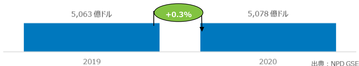
〈図表1〉2019年-2020年 グローバルスポーツ製品市場規模

2020年の全世界におけるスポーツ製品市場は56兆円（=5078億ドル）となり、新型コロナウイルス感染拡大の影響を受けながらも、前年比0.3%増とわずかに成長しました。（図表1）