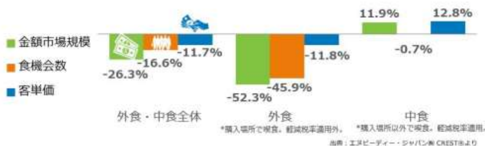
<図表1> 外食・中食市場 成長率 2021年5月計 vs. 2019年5月計 %

外食・中食市場全体の2021年5月の2019年同月比（図表1）をみると、売上（金額市場規模）が26.3%減少、客数（食機会数）が16.6%減少しました。感染拡大による影響のピークは、2020年4月で市場規模41.9%減でした。5月37.7%減、6月23.6%減、7月19.4%減、8月19.8%減、9月17.5%減、10月8.9%減、11月12.4%減、12月19.2%減。2021年は1月26.3%減、2月24.4%減、3月21.9%減、4月23.7%減、そして5月に26.3%減（いずれも2019年同月比）と同年1月と同水準まで減少しました。