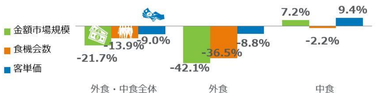
<図表1> 外食・中食市場 成長率 2021年1-12月計 vs. 2019年1-12月計 %

外食・中食市場全体の2021年1-12月計の売上は、16兆5096億円で、コロナ前の2019年同期比で21.7%減少でした（図表1）。前年同期比では、4.2%減で、2020年より市場が落ち込んだことが分かります。外食（イートイン）売上が2019年同期比42%減（2020年同期比13.5%）で大幅減でした。