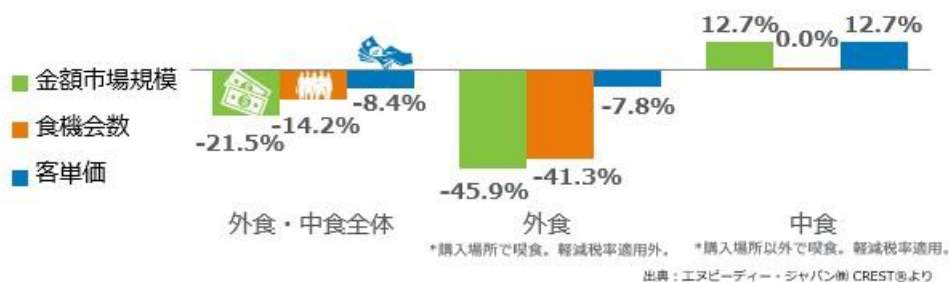
<図表1> 外食・中食市場 成長率 2022年2月計 vs. 2019年2月計 %

外食・中食市場全体の2022年2月の2019年同月比（図表1）をみると、売上（金額市場規模）が21.5%減少、客数（食機会数）が14.2%減少しました。感染拡大による影響のピークは、2020年4月で市場規模前年同月比41.9%減でした。2020年10月には8.9%減まで回復したものの、その後の感染拡大で再び悪化しました。2021年は1月26.3%減、2月24.4%減、3月21.9%減、4月23.7%減、5月26.3%減、6月は27.6%減、7月は19.9%とやや改善したものの、8月は感染が急拡大して27.3%減と再び悪化、9月は酒類提供自粛で客単価が下がり、28.8%減とさらに悪化しました。10月に全都道府県で緊急事態宣言が解除され12.1%減、11月12.0%減、12月10.7%減と横ばいでした。年明け後、オミクロン株によって感染が急拡大したため、1月末までにまん延防止等重点措置が34都道府県下に適用となり、2022年1月は15.3%減、2月はさらにまん延防止等重点措置の適用地域拡大・延長となり、21.5%減でした。