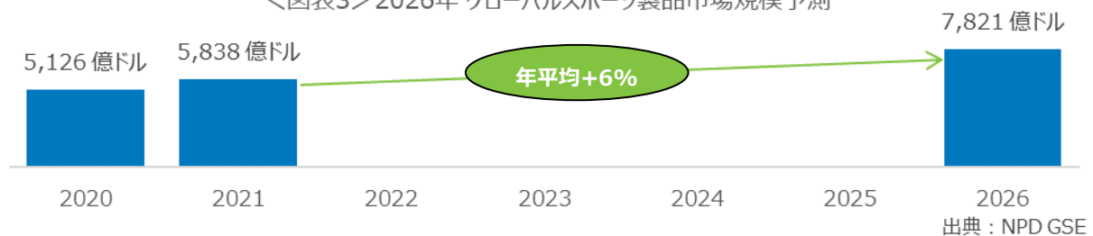
<図表3> 2026年 グローバルスポーツ製品市場規模予測

エヌピーディー・ジャパンのスポーツ事業部アカウントマネージャーである、伊藤和正（いとう・かずまさ）は、「2021年のスポーツ製品市場は前年比+14%と大きな成長を見せ、グロー