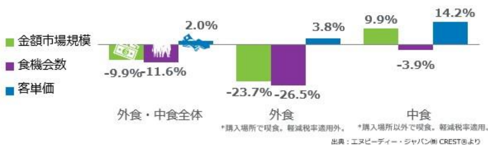
<図表1> 外食・中食市場 成長率 2022年9月計 vs. 2019年9月計 %

外食・中食市場全体の2022年9月の2019年同月比（図表1）をみると、売上（金額市場規模）が9.9%減、客数（食機会数）が11.6%減でした。感染拡大による影響のピークは、2020年4月で市場規模前年同月比41.9%減でした。2020年10月に9%減まで回復したものの、その後2021年1月、4月、7月の緊急事態宣言で20-39%減の状態が続きました。2021年9月末に緊急事態宣言が解除、12月には10.7%減まで回復しました。2022年は、まん延防止等重点措置（以下、まん防）が適用され、2月は21.5%減まで落ち込みました。3月に全地域でまん防が解除され、3年ぶりに規制のない大型連休で始まった5月は同7.7%減まで回復しました。しかし、感染拡大第7波で、7月は同7.9%減、8月は感染者数が過去最大となり、同13.0%減と後退、9月は同9.9%減で同年6月と同水準で、客数は前月と変わりませんでした。