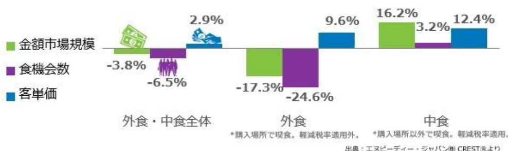
<図表1> 外食・中食市場 成長率 2022年12月計 vs. 2019年12月計 %

外食・中食市場全体の2022年12月の2019年同月比（図表1）をみると、売上（金額市場規模）が3.8%減、客数（食機会数）が6.5%減、客単価は2.9%増でした。感染拡大による影響のピークは、2020年4月で市場規模前年同月比41.9%減でした。2020年10月に9%減まで回復したものの、その後2021年1-9月は20-39%減の状態が続きました。2021年9月末に緊急事態宣言が解除、12月には10.7%減まで回復しました。2022年は、まん延防止等重点措置（以下、まん防）が適用され、2月は21.5%減まで落ち込みました。3月に全地域でまん防が解除され、3年ぶりに規制のない大型連休で始まった5月は同7.7%減まで回復しました。しかし、感染拡大第7波で、7-9月は後退。10月は全国旅行支援開始などで、消費活動が活発化し、同0.3%増と2019年同月と同水準まで回復しました。11月は感染第8波で同4.8%減とやや後退。12月は同3.8%減でやや回復しました。客数は同6.5%減と10月と同程度まで回復したものの、単価の低い小売の好調により、客単価が同2.9%増と抑えられました。