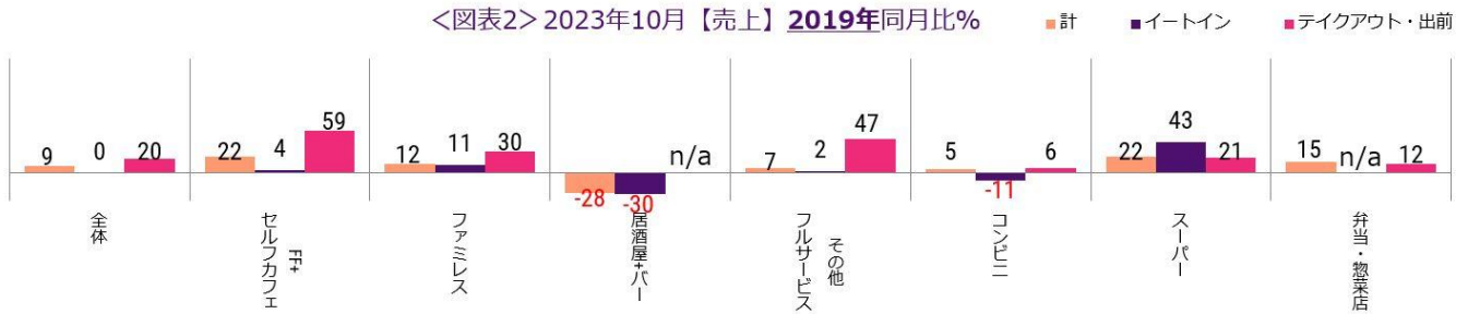
<図表2> 2023年10月【売上】2019年同月比