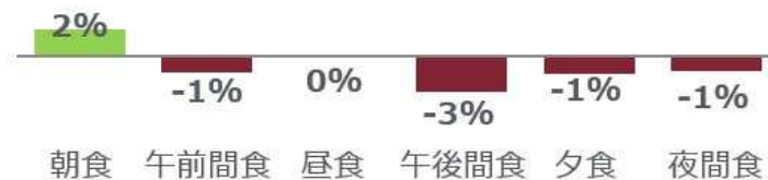
<図表3> 食機会別 食機会数成長率 2019年第3四半期 vs. 2018年第3四半期 %

食機会別の食機会数成長率（図表 3）をみると、朝食が+2%で、成長が続いている朝食のみが増加しました。